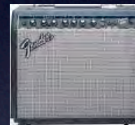
Amplificador de Guitarra