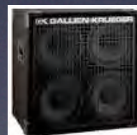
Amplificador de Baixo